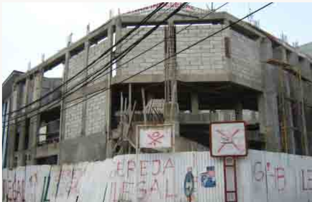
Gedung GPIB Jemaat Galilea Villa Galaxi, Kota Bekasi, yang disegel massa. Ironis, di dalam negara Pancasila, membangun tempat hiburan malam jauh lebih mudah ketimbang membangun rumah ibadah.