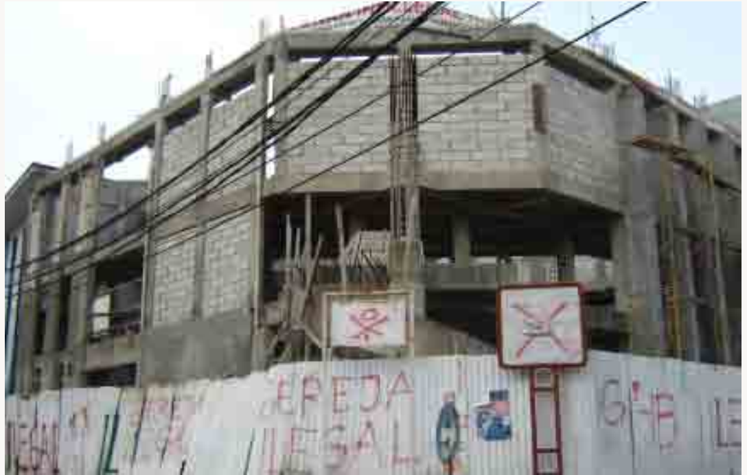
Gedung GPIB Jemaat Galilea Villa Galaxi, Kota Bekasi, yang disegel massa. Ironis, di dalam negara Pancasila, membangun tempat hiburan malam jauh lebih mudah ketimbang membangun rumah ibadah.